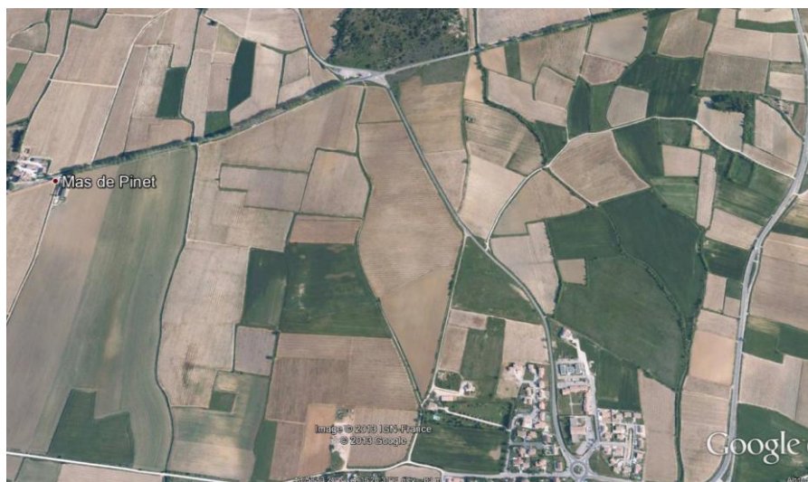
nord de St Chaptas Prissan des compoix se trouve entre le ruisseau de Saint Estève et le ruisseau de Gaudiaco ( le Rieu)

Il occupait ce que nous appelons le Clapas actuellement et descendait peut-être sur l'Argile, les Maillets et une partie des Gourgues, le long du ruisseau.