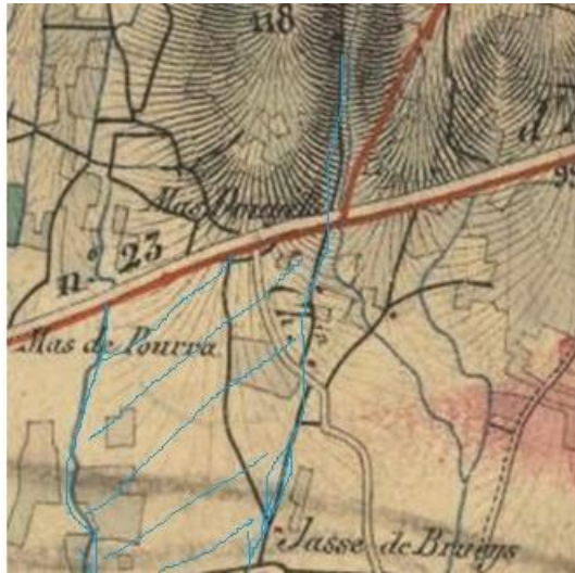
Carte d'Etat Major de 1862 sur laquelle on voit le territoire de Prissan et le chemin de St D z ry qui longe encore le ruisseau.